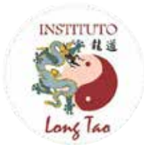
Instituto Long Tao