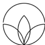
LONDON WELLNESS ACADEMY