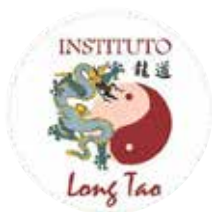
Instituto Long Tao